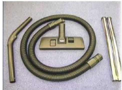
Les accessoires ▶