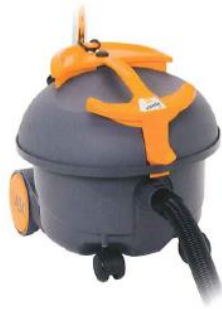
◀ Aspirateur à poussières